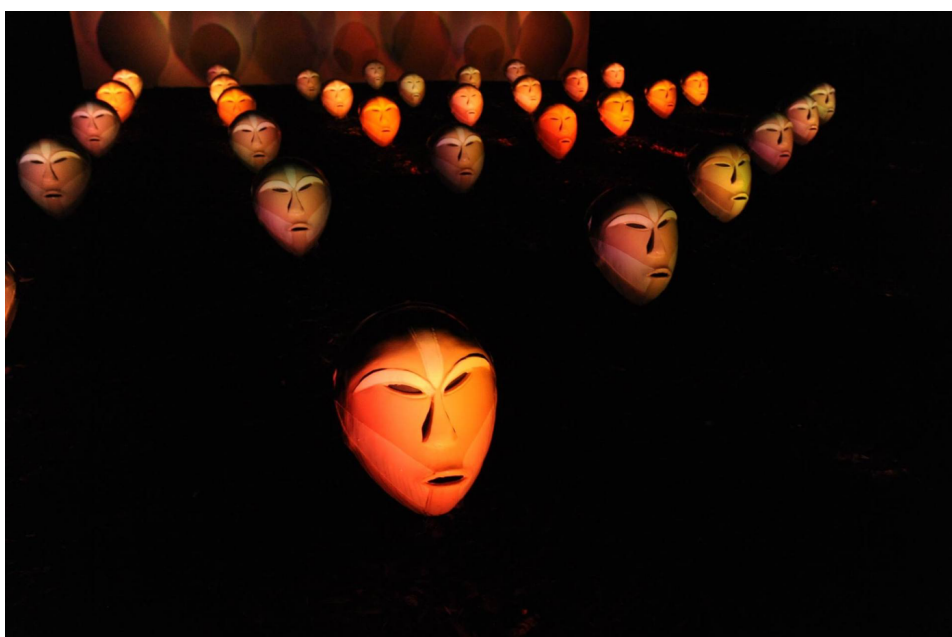
L'edizione 2017 del Festival delle luci CidneOn.

By Redazione BsNews.it - gennaio 23, 2018